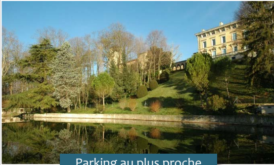
Parking au plus proche du terrain !

Nous aurons à notre disposition de grandes tables et des bancs. Si vous le souhaitez, vous pouvez apporter vos propres chaises afin d'être mieux installé.